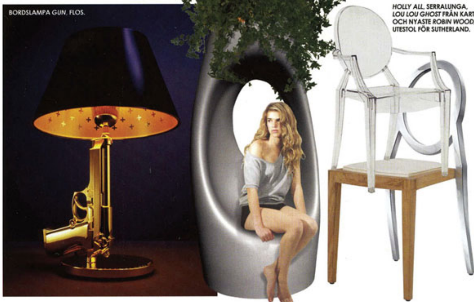
BORDSLAMPA GUN, FLOS.